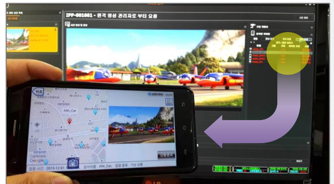
스마트 폴리스 APP 에서 할당 된 영상 관제 및 PTZ 제어