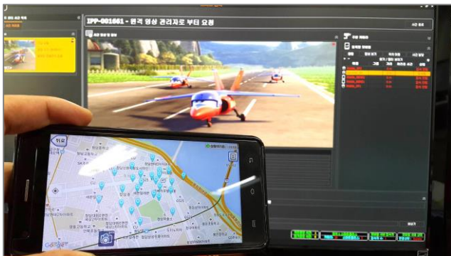
스마트센터에서 해당 사용자에게 영상 할당